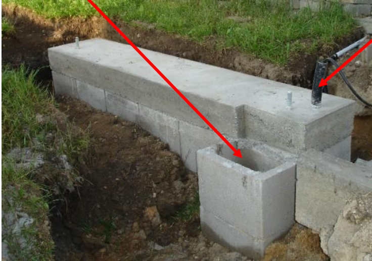
Aufsetzen und Fixierung des Tores

Aussparung für einen Stahlpfosten- der später gegenüber der Antriebssäule eingelassen und betoniert wird. Leerrohr mit 3 x 1,5 Erdkabel